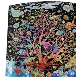
スクラッチアート 海の生き物